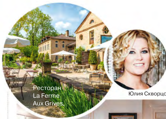
Ресторан La Ferme Aux Grives.