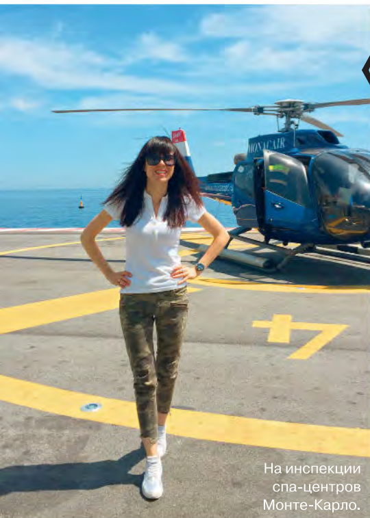
На инспекции спа-центров Монте-Карло.

« Н е сдавайся!» — прикрикнул, хотя нет, заорал на меня, обессиленную, мой проводник на подступах к вершине Килиманджаро. Тогда, чтобы хорошенько прочистить голову, мне позарез нужен был подвиг. Подвиг сделал свое дело: в Москву я вернулась уже другим человеком, с кристально чистой головой и готовой не просто покорять — сворачивать горы.