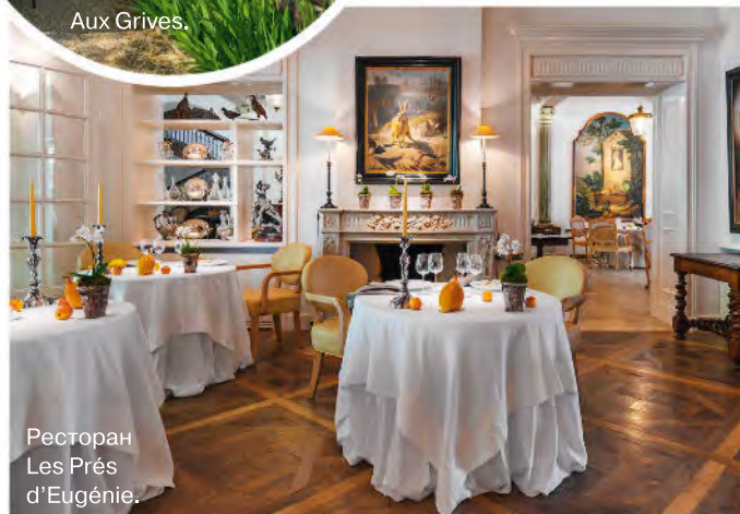
Ресторан Les Prés d'Eugénie.