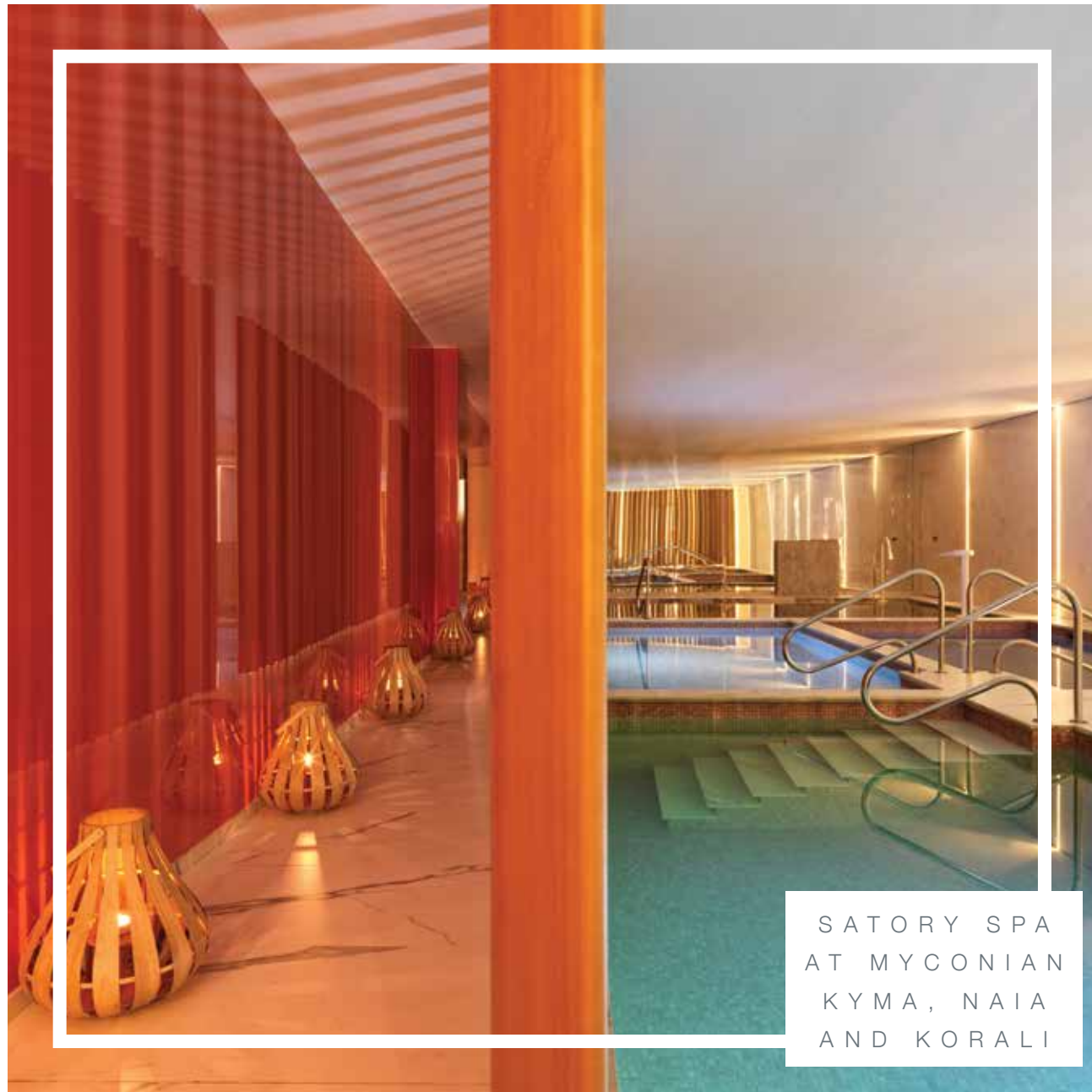
SATORY SPA AT MYCONIAN KYMA, NAIA AND KORALI