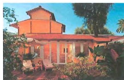
The Boutique Spa La Serra

Boutique Spa La Serra является - настоящий оазис площадью 150 кв м, стоящий на месте оранжереи 19 века. Рядом с бассейном, в окружении оливковых и апельсиновых деревьев, он купается солнечных лучах большую часть дня. СПА-центр был построен в соответствии с правилами фэшн-шуй и исповедует комплексный подход. Гармония души и тела достигается за счет эксклюзивных и заряжающих энергией процедур.