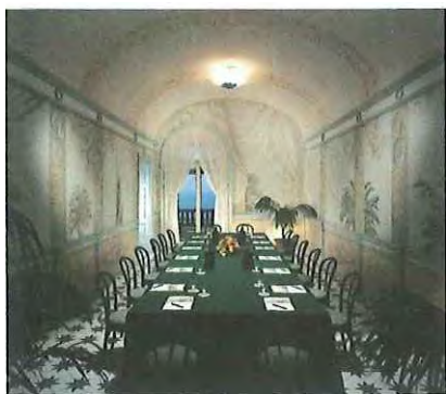
The Stuart Meeting room

Конференц-зал Tarantella декорировал бельгийский дизайнер Тьерри Боске: на стенах изображены сцены с танцорами, исполняющими итальянские народные танцы, - отсюда и название. Его уютная и в то же время роскошная обстановка идеально подходит для совещаний и конференций с участием до 100 человек.