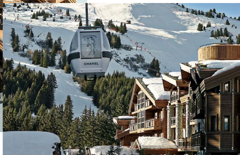
Слева направо: фасад L'Apogée Courchevel; панорамный вид из отеля на склоны и Куршевель 1850; интерьер номера Prestige Suite