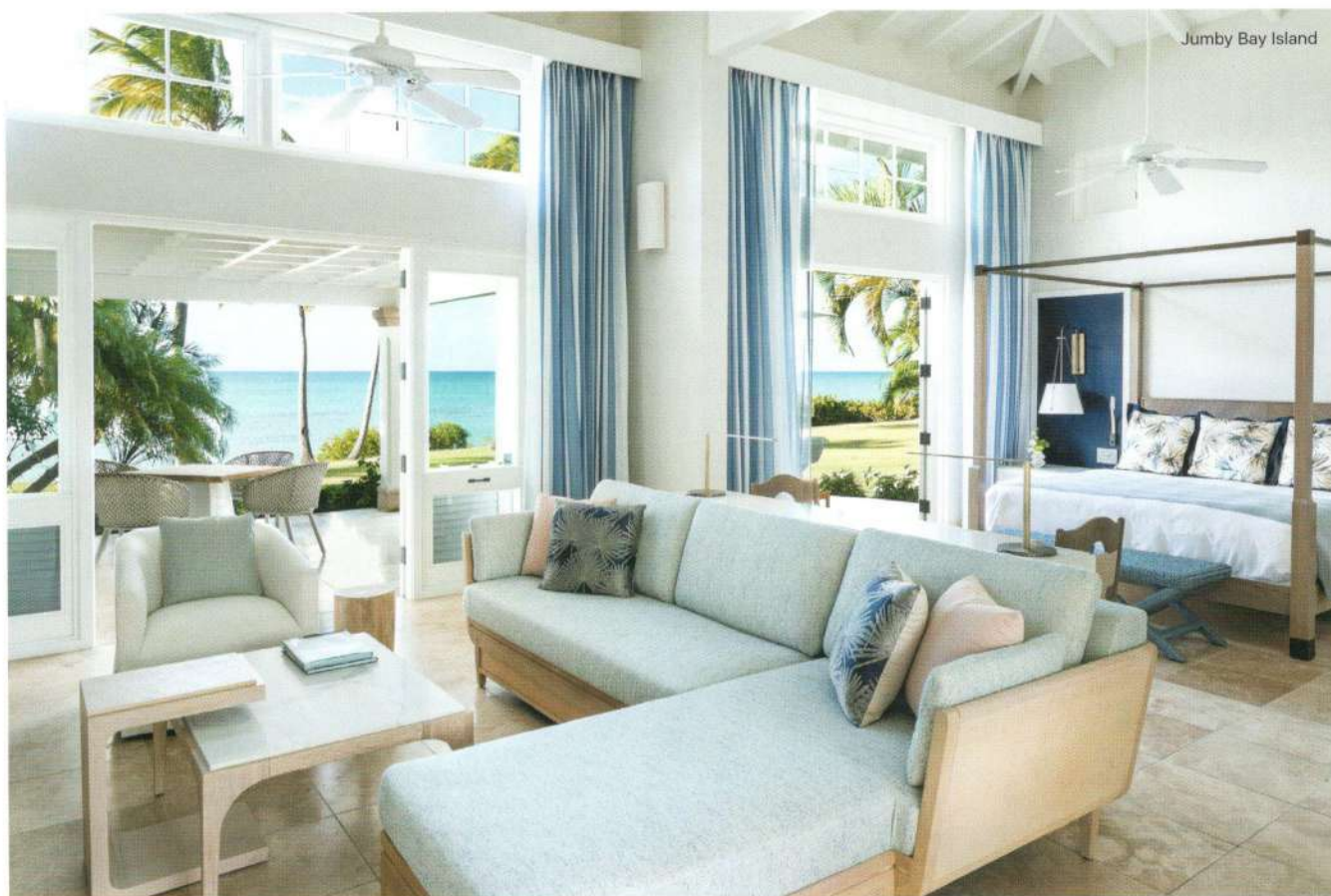
Jumby Bay Island