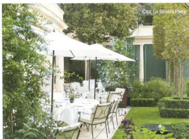
Сад Le Bristol Paris

лучше, поэтому у нас всегда много новостей. Недавно, например, в Le Bristol Paris открылся полностью обновленный сад — тот самый, которым так гордится отель. Здесь гости могут спрятаться от суеты, побыть в тишине в окружении зелени и цветов, чтобы послушать пение птиц.