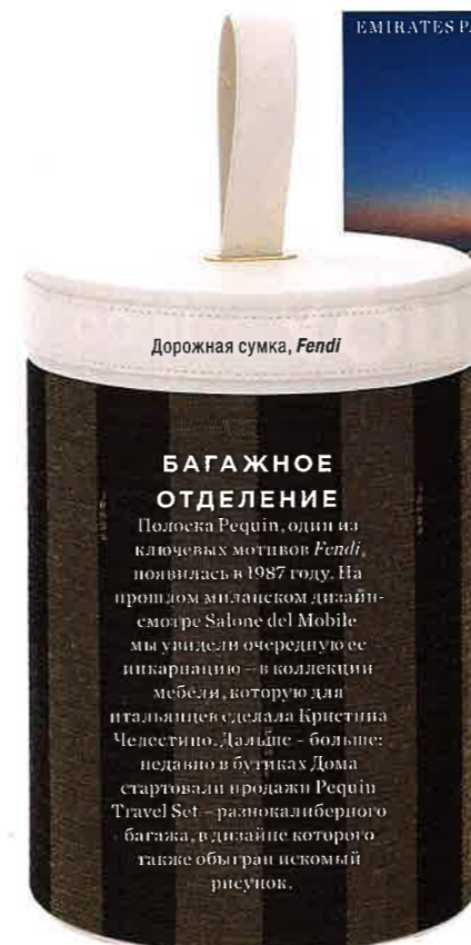
Дорожная сумка, Fendi