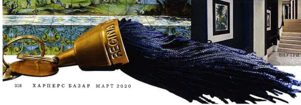
ВНУТРИ ЗДАНИЯ ROYAL

Даша, что заставляет тебя каждый раз возвращаться в Regina Isabella?