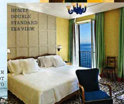
HOMER DOUBLE STANDARD SEA VIEW