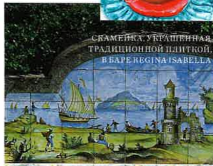
СКАМЕЙКА, УГРАЩЕННАЯ ТРАДИЦИОННОЙ ПЛИТКОЙ, В БАРЕ REGINA ISABELLA