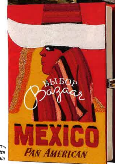
Клатч, Charlotte Olympia

КОРОТКО О ГЛАВНОМ: ИНТЕРЕСНЫЕ НАПРАВЛЕНИЯ И АКТУАЛЬНЫЕ ПРЕДЛОЖЕНИЯ