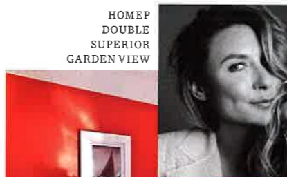
НОМЕР DOUBLE SUPERIOR GARDEN VIEW