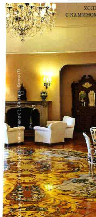
ХОЛЛ С КАМИНОМ