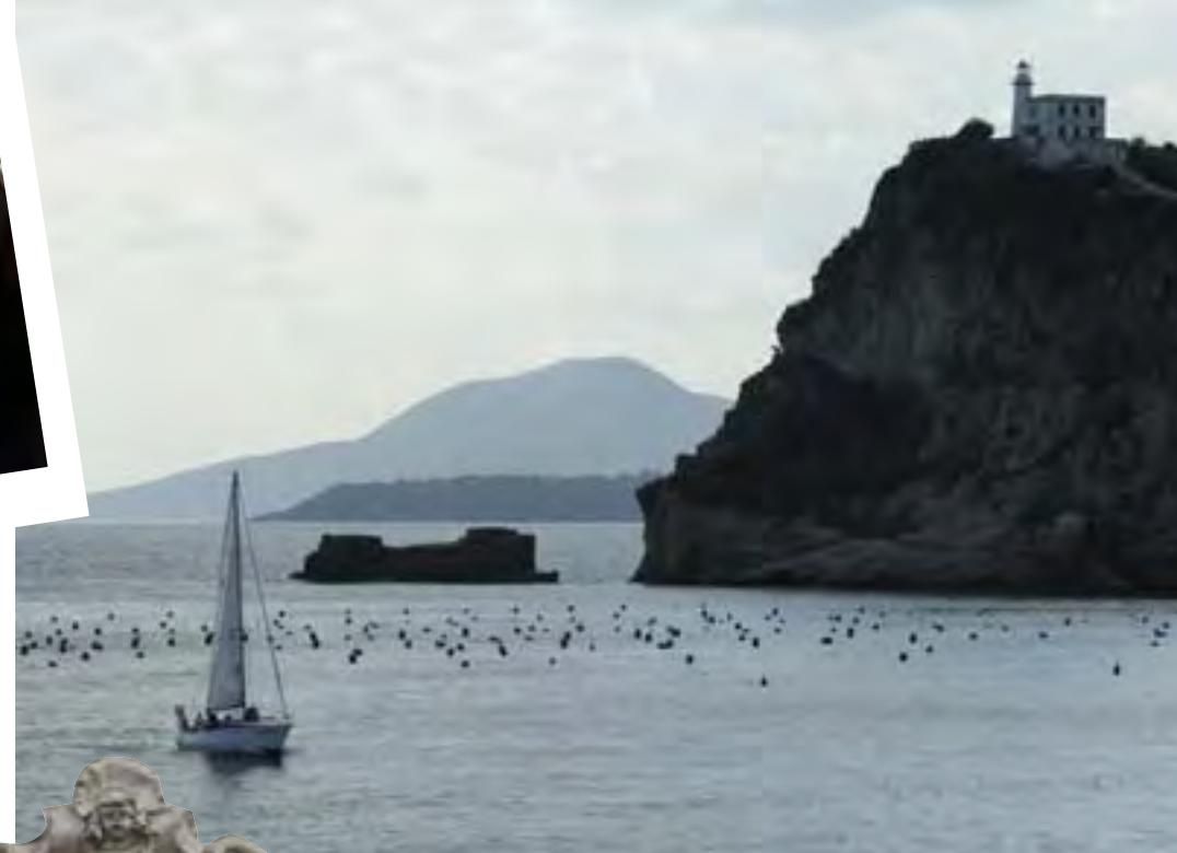
Состоятельные обитатели острова Капри уже давно с интересом поглядывают на Искью, привлекающую девственной природой и старинной архитектурой.