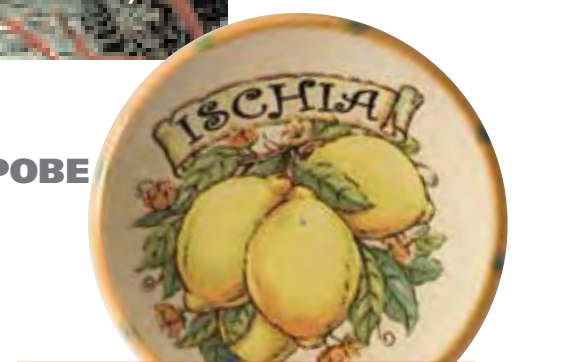
Бокал белого вина на Искье не менее целобен, чем термальные источники.