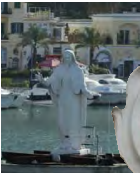
Островитяне религиозны и благочестивы в большей мере, чем жители континента.