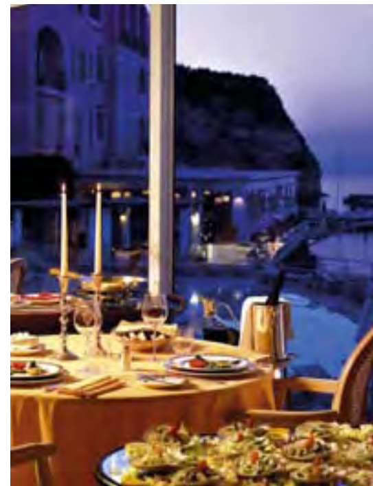
Тут в полной мере ощущаешь смысл фразы “сладкая жизнь”.

Хозяин курорта намерен и дальше приглашать знаменитостей на остров, искушая их всевозможными благами и праздниками. А вместе с ними и тех, в чьих сердцах живут две, но пламенные страсти: любовь к жизни и удовольствиям. Для итальянцев эти понятия неразделимы, как искусство и красота, и передаются на генетическом уровне. Во всяком случае, те, кто обладают врожденным чувством вкуса, этот талант будут проявлять в любой сфере жизни, будь то философия, дизайн или кулинария.