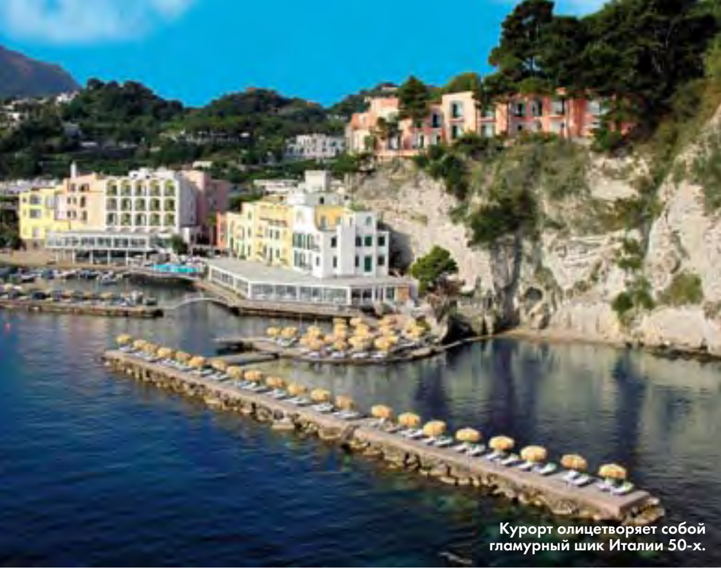
Курорт олицетворяет собой гламурный шик Италии 50-х.