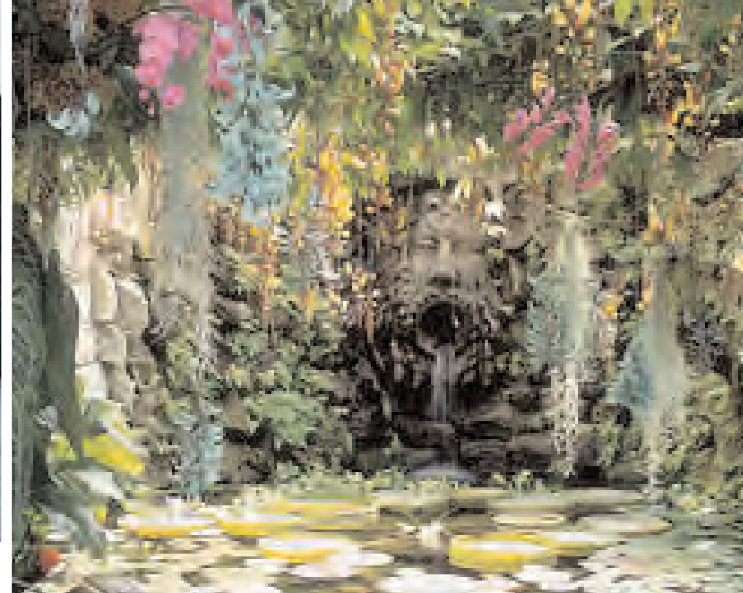
В термальных парках острова встречаются поистине райские уголки.

Кульминацией моего пребывания на острове стали прогулки к термальным источникам, каковыми он усеян едва ли не гуще, чем поселками. Правда, в отеле мне говорили о наличии семидесяти родников, в то время как местные жители горячо убеждали в существовании не менее трех сотен. На самом деле достаточно почтить своим вниманием два. Это источники, бьющие прямо в море, поблизости деревни Сорджетто, в чью теплую смесь морской и термальной воды особенно приятно окунуться прохладным апрельским утром. И термы в скале с забавным названием Кава Скура, куда древние римляне приходили париться и размышлять о судьбах отечества. Легкий пар, избавляя от токсинов, действительно повышает умственную активность. Возможно, однажды, как следует ее простимулировав, один из античных сибаритов открыл необычный метод лечения, который до сих пор практикуют в деревушке Сант Анджело. Погружение в горячий, пропитанный термальными водами песок оказывает непревзойденный терапевтический эффект на дыхание, обмен веществ и нер-