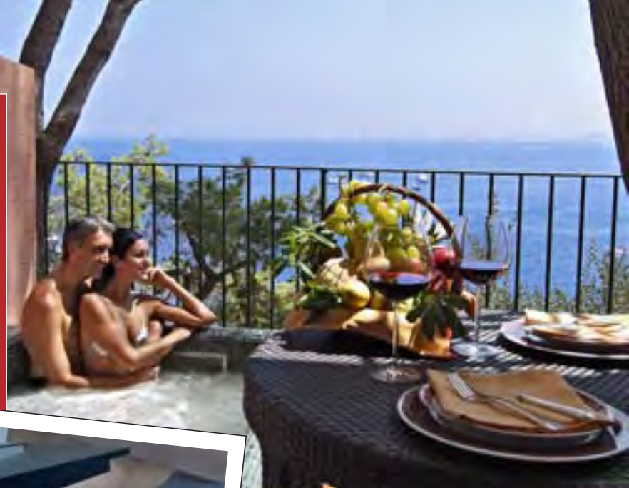
Эффект после spa -процедуры в личном джакузи можно закрепить диетическими блюдами, которые при всей своей малокалорийности необычайно вкусны.