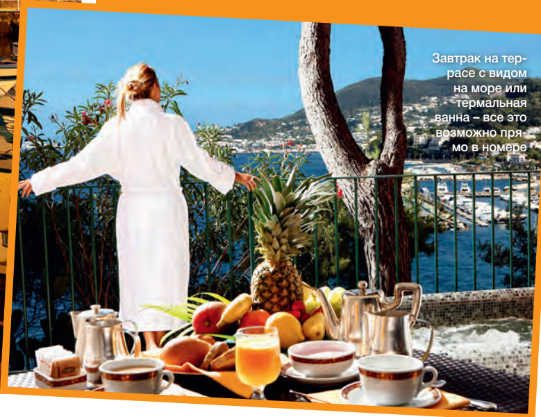
Завтрак на террасе с видом на море или термальная ванна – все это возможно прямо в номере