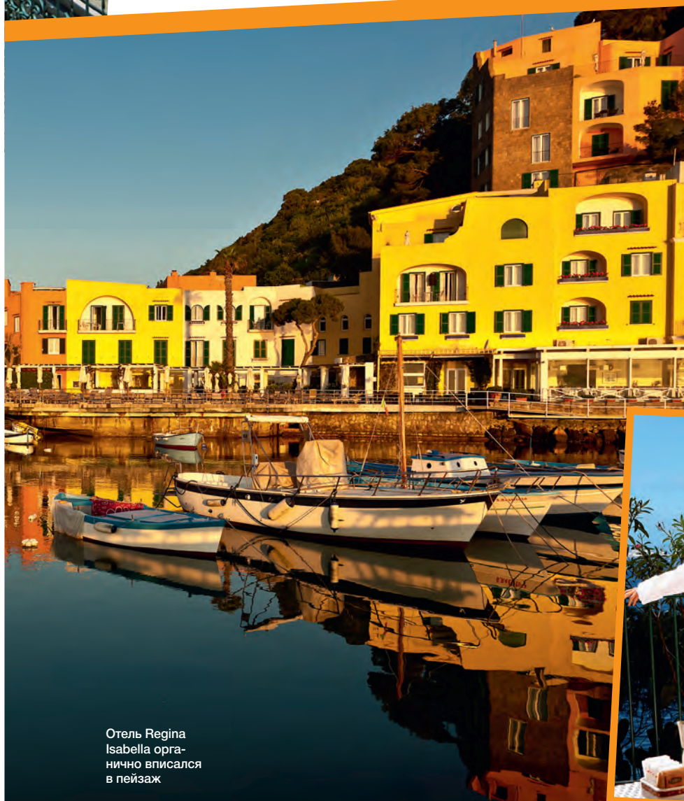
Отель Regina Isabella органично вписался в пейзаж

ЧЕМ ЗАНЯТЬСЯ? Конечно же, купаться – и в море, и в термальных источниках. Причем, чтобы забраться в последние, не нужно выходить за пределы гостиницы: у нее есть четыре собственных! В SPA-комплексе Regina Isabella вы найдете бассейн с целебной водой и гидромассажами, а также меню процедур с минеральными грязями. Хотите полного единения с природой – выбирайте съют в корпусе Royal с персональной термальной ванной на балконе, видом на море и скалы: никого, кроме вас и любителей чашек! Или поднимитесь в горы, чтобы добраться до кратера одного из потухших вулканов – на Искье их больше десятка. Если же вы, напротив, жаждете общества, отправляйтесь в ближайший термальный парк Негомбо – он расположен в пяти минутах ходьбы от отеля. ☺