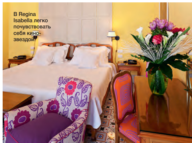
В Regina Isabella легко почувствовать себя кинозвездой.