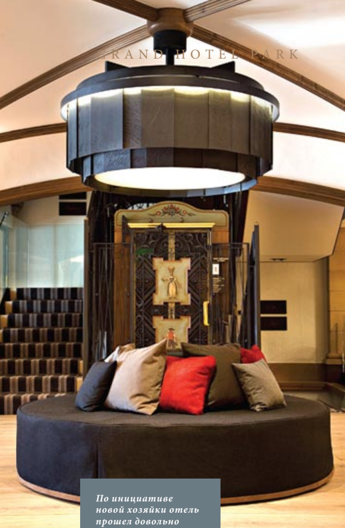
По инициативе новой хозяйки отель прошел довольно радикальный курс интерьерного омоложения