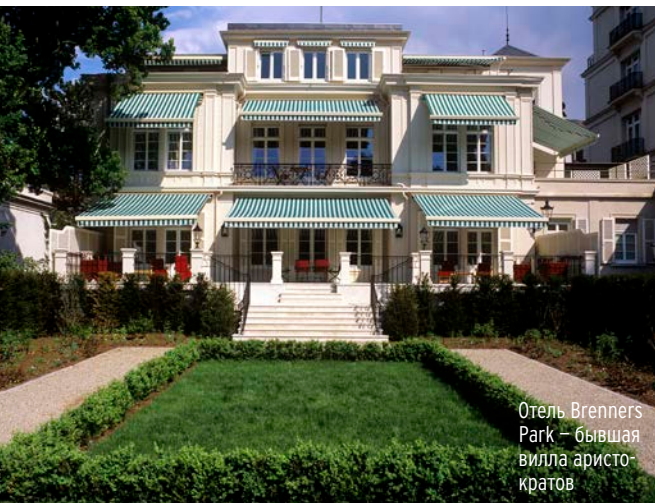
Отель Brenners Park – бывшая вилла аристократов