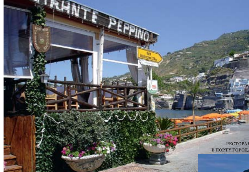
РЕСТОРАН В ПОРТУ ГОРОДА