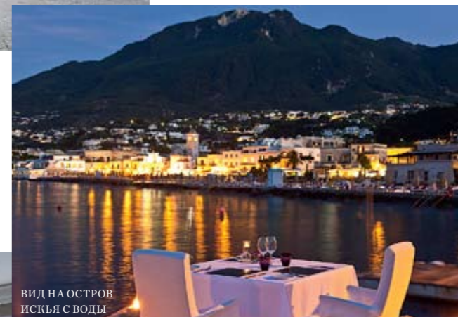
ВИД НА ОСТРОВ ИСКЬЯ С ВОДЫ

В РАЗНОЕ ВРЕМЯ В ОТЕЛЕ L'ALBERGO DELLA REGINA ISABELLA КАНИКУЛЫ ПРОВОДИЛИ ЧАРЛИ ЧАПЛИН, АВА ГАРДНЕР И ЭЛИЗАБЕТ ТЕЙЛОР.