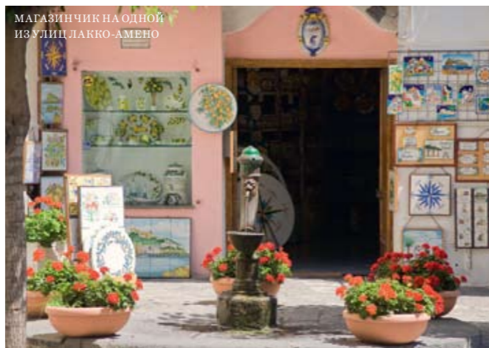
МАГАЗИНЧИК НА ОДНОЙ ИЗ УЛИЦ ЛАККО-АМЕНО

Здание гостиницы построено на месте старинных римских терм, в окружении сосновой рощи. Сюда приезжают