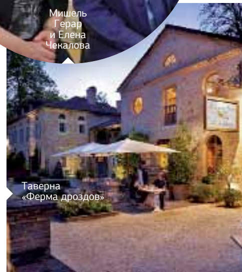
Таверна «Ферма дроздов»