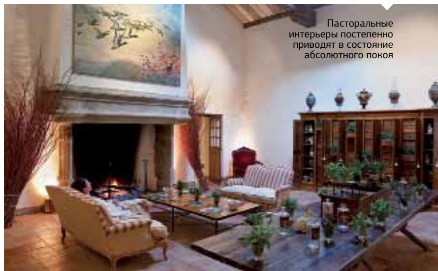
Пасторальные интерьеры постепенно приводят в состояние абсолютного покоя