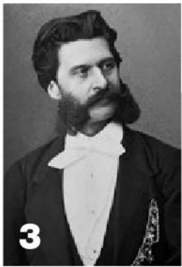
Уолт Дисней (1), канцлер Отто фон Бисмарк (2), Иоганн Штраус (3), Билл Клинтон (4), Фрэнк Синатра (5), принц Чарльз (6), Тина Тернер (7)